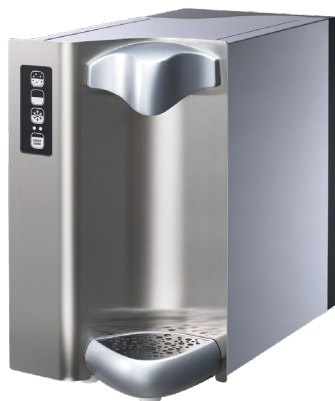
Wave 30 (höhere Ausschankzone, optional)

Elegant, vielseitig, wirksam gänzlich aus Edelstahl auch mit Heißwasser bis zu 95°C