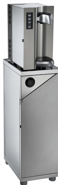
Wave Standgerät Unterschrank mit Becherhalter (optional)