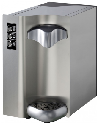
Wave I.T. 30 mit Edelstahl-Tasten