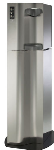
Wave Curved Standgerät (optional nur für Wave 60)